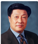
郝希山 院士 国家肿瘤临床医学研究中心主任 中国抗癌协会理事长